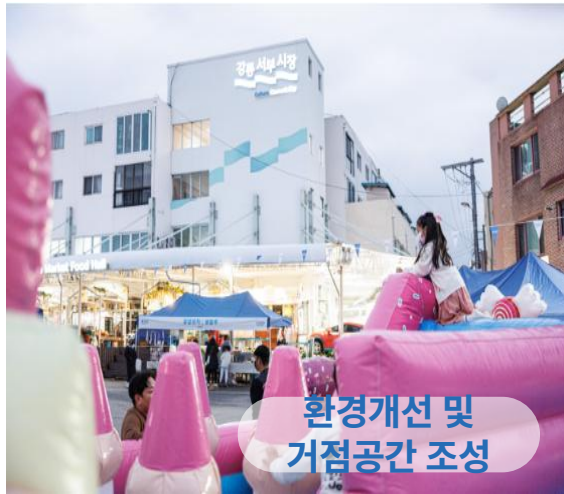
환경개선 및 거점공간 조성

힐링과 트렌드를 선도하는 여행지로 꼽히는 강릉. 그 이면에는 자연 경관 중심 관광지의 지속적인 관광 콘텐츠의 부재, 구도심의 노후화와 청년층 일자리 부재로 인해 위험단계에 진입한 고령화 등 지역 내에서 문제로 자리잡고 있습니다. 강릉 서부시장은 지역을 하나로 연결해 줄 강릉 주요 거점들의 교차점에 위치해 지리적 이점을 가지고 있으나 낙후된 시설과 로컬 콘텐츠의 부재로 유동 인구가 점차 감소하며 침체된 기존의 이미지를 개선하고 문화의 허브(HUB)로 거점 공간을 조성하는 변화가 필요했습니다.