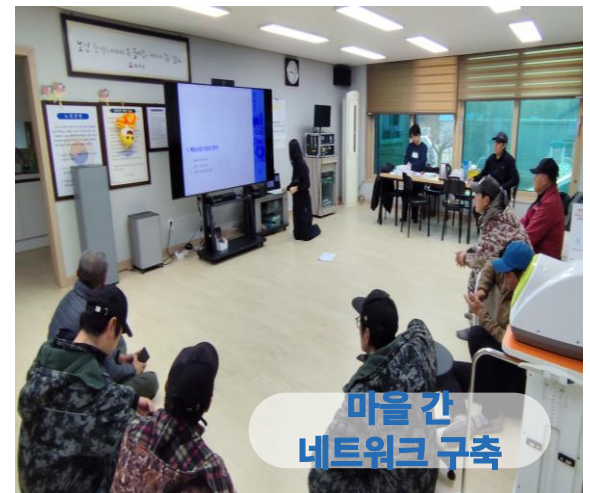
마을 간 네트워크 구축